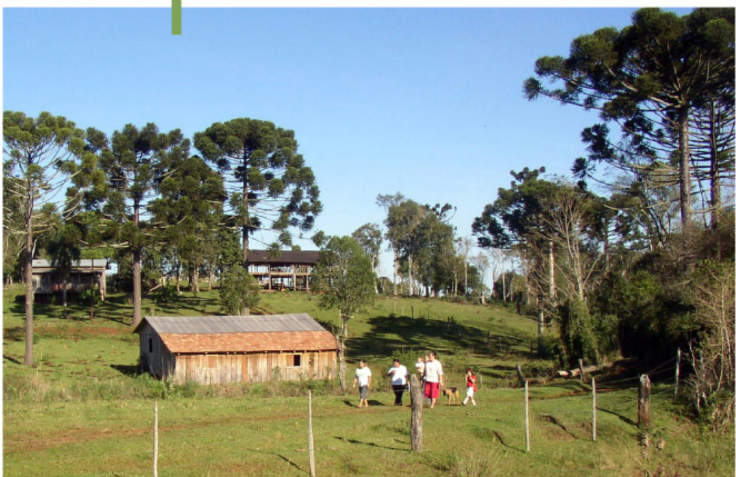
Paisaje rural característico de San Pedro, la tierra de las araucarias.