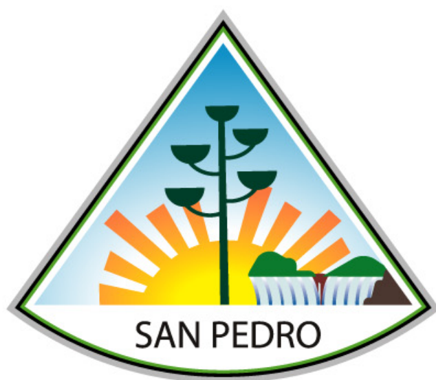
Escudo Municipal de San Pedro