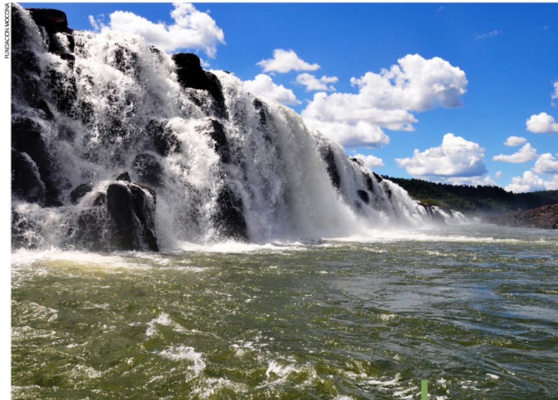
Los deslumbrantes Saltos del Moconá convocan a miles de turistas anualmente.

Por allí pasó, en 1892, el etnógrafo y naturalista Juan Bautista Ambrosetti, señalando que: “San Pedro de Monteagudo está situado en medio de un enorme pinar rodeado de yerbaes: no es precisamente un abra, sino un campo alto, lleno monte, de árboles altos, limpio abajo, en una palabra, un fascinal; tendrá 30 casas entre todas, ninguna de negocio: unas 7 son de blancos y las demás las ocupa el resto de la tribu del cacique Maidana”.