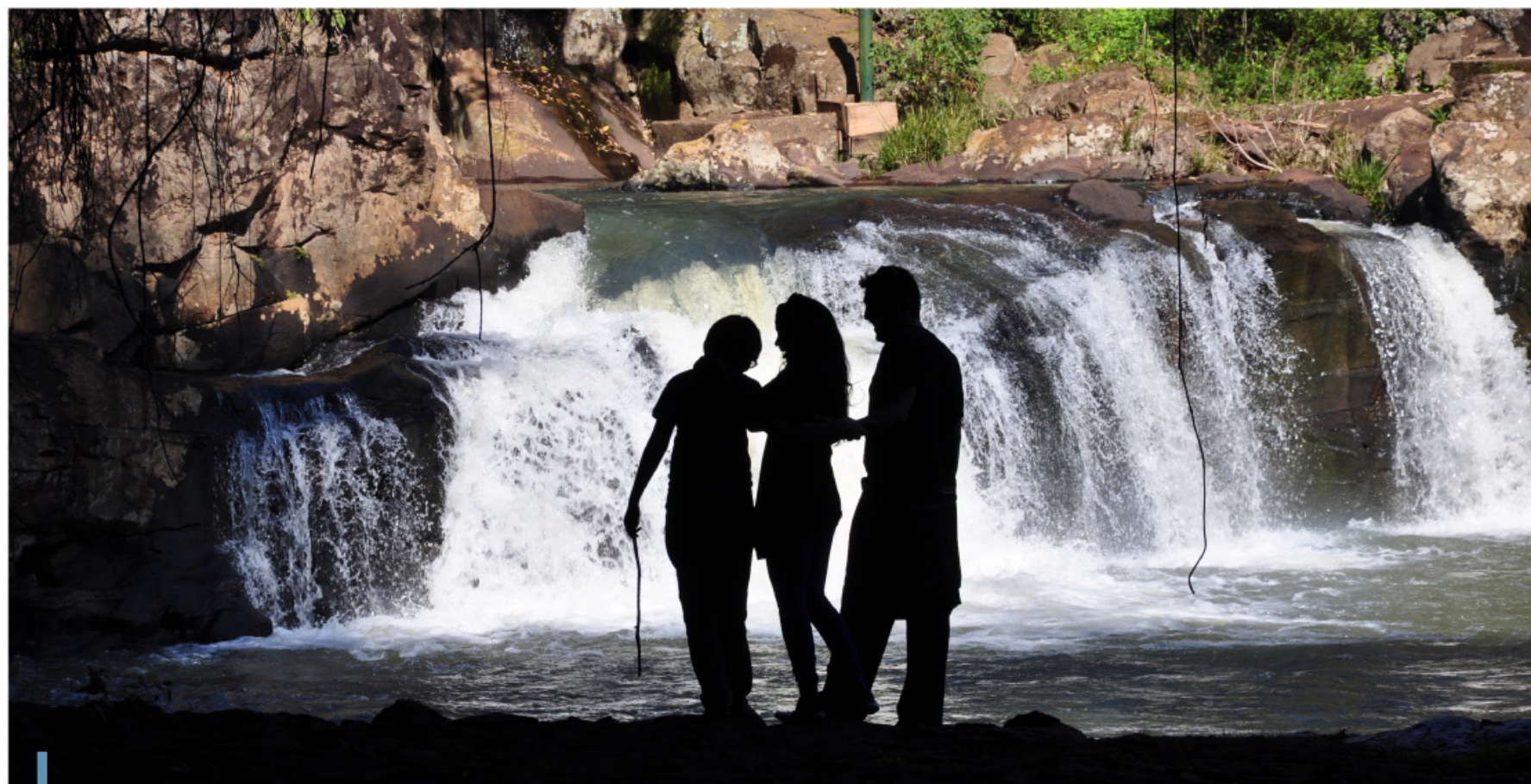
La Gruta India es el principal atractivo turístico del Departamento Libertador General San Martín. En él también se halla el salto Tres de Mayo sobre el arroyo homónimo.

Fuentes: Stefañuk, Miguel Ángel. “Diccionario Geográfico Toponímico de Misiones”. Contratiempo Ediciones, 2009 / Instituto Nacional de Estadística y Censos / Wikipedia / Google Maps