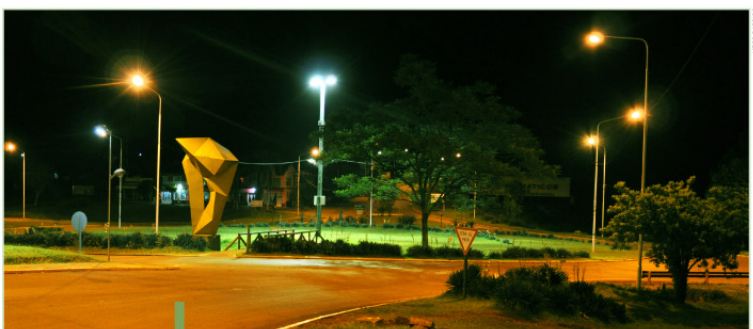
Abajo: Parque Lineal Caingú, espacio público representativo de la ciudad.

Tupá, con su poder sobre todas las cosas, había creado el ensañador "Salto Encantado", a modo de recuerdo eterno de dos de sus hijos, aquellos que se amaron más allá de las diferencias.