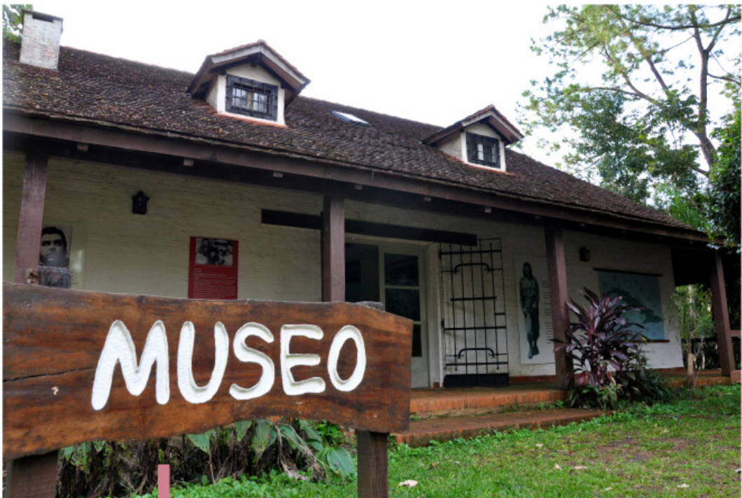
Solar donde el Che Guevara viviera sus primeros años de niñez, hoy museo histórico. Abajo izquierda: Capilla Santa Rita rodeada de la exuberante vegetación misionera. Abajo derecha: La belleza de la isla Caraguatay, como ofrenda a los amantes de la naturaleza. Página anterior: Fruto del caraguatá, de donde toma su topónimo el arroyo que, a su vez, da nombre al pueblo y al municipio homónimo.

menos dos comunidades vegetales: las Selvas Marginales y las Selvas Mixtas de laurel y guatambú. Por la tranquilidad que transmite y por la espectacularidad de sus atardeceres y amaneceres, es un lugar habitual de descanso para pescadores deportivos. En la isla es posible encontrar ejemplares de agutíes ( Dasyprocta ), monos caí ( Sapajus apella ) y pacas ( Cuniculus paca ), entre otras especies.