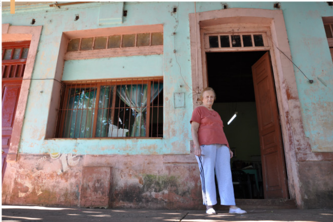
Detrás de la afable moradora se puede percibir una de las típicas viviendas de la antigua capital del Territorio Nacional de Misiones.

La refundación del pueblo, por su parte, se produjo mediante una ley de la Cámara Legislativa de la Provincia de Corrientes, el 27 de septiembre de 1877. La norma ordenaba la creación de pueblos y colonias al Nordeste de aquella provincia, así como en casi todas las reducciones jesuíticas bajo dominio argentino. Sin embargo, el trazado del pueblo y centro agrícola