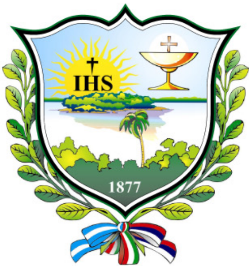
Bandera Municipal de Corpus