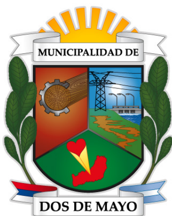
Escudo Municipal de Dos de Mayo

Forma: cuadrilongo con la base redondeada, partido y entado en punta, filiera de sable, timbrado.