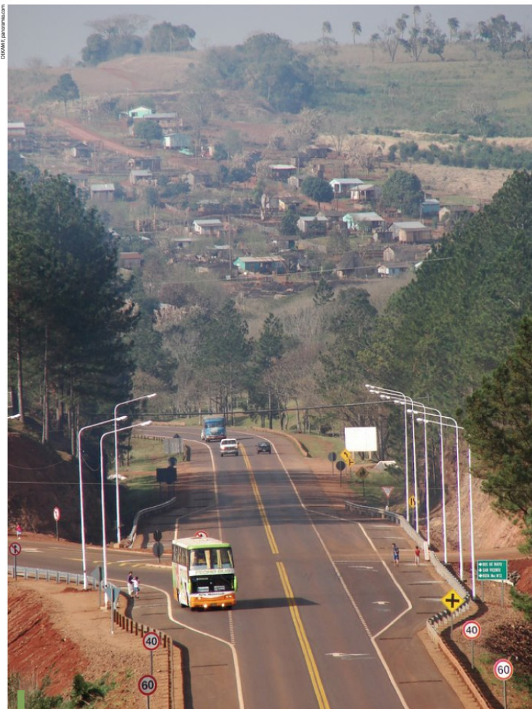
Empalme de la Ruta Nacional 14 y la Provincial N° 11, donde inicia la localidad Dos de Mayo.

Fuentes: Stefañuk, Miguel Ángel. "Diccionario Geográfico Toponímico de Misiones." Contratiempo Ediciones, 2009 / Municipalidad de Dos de Mayo / Instituto Nacional de Estadística y Censos / www.heraldicaargentina.com.ar/ / Wikipedia / Google Maps