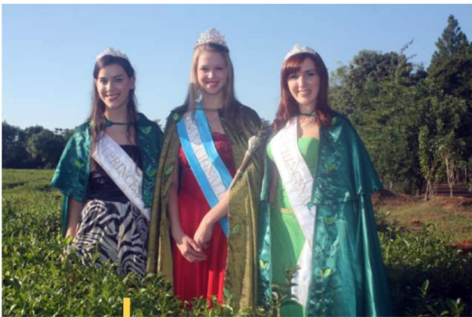
Bellas jóvenes misioneras participan en la Fiesta Nacional del Té.

En esa época, el propio Gordillo describió la región campoviense del siguiente modo: "Está cubierta de bosque con excepción de su parte Norte donde éste desaparece en coincidencia con una marcada depresión de relieve, en parte pedregoso y donde el bosque da lugar a una serie de capueras y machones de monte espinoso, que ha recibido el nombre de 'Campo Viera'".