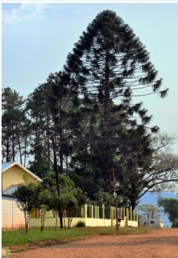
Uno de los dos CAPS de Bonpland, bajo el verde follaje que aún conserva el municipio.

importante fábrica, Bonpland se destacó en la provincia en la manufactura de tabacos. En 1927 inició su actividad la compañía Nobleza de Tabacos , con un equipo de técnicos llegados de Europa. La decadencia de su colonia, empero, también se manifestó en el pueblo. Luego de una caída en la tasa demográfica durante el período intercensal de 1970-1980, el pueblo recuperó su vigor, y entre 1991 y 2001 su población creció un 40,9%.