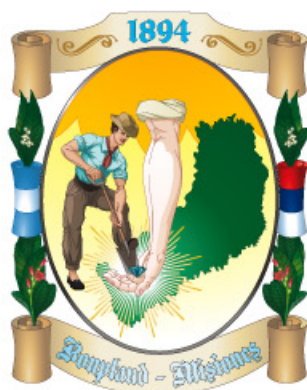
Escudo Municipal de Bonpland

El escudo municipal de Bonpland fue realizado mediante un concurso entre alumnos de las escuelas, al conmemorarse el centenario del pueblo, en 1994. Los trabajos que resultaron ganadores fueron los de los estudiantes Sandra Feldich y Gustavo Fuglistaler.