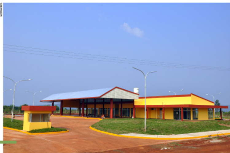
La nueva terminal de ómnibus de Bonpland acompaña el crecimiento del toque de andén.

El pueblo que poco a poco se fue gestando conoció un momento de esplendor hacia la década de 1920, cuando se convirtió -junto a Cerro Corá- en el centro de servicios de las colonias vecinas. Con una