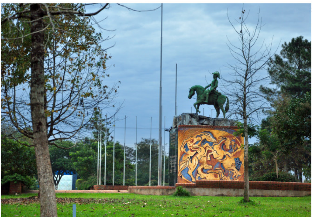
La Plaza San Martín es centro de reuniones sociales y marco apropiado para actos oficiales.

Estos sitios de interés turístico que ofrece Puerto Rico son apuntalados por una infraestructura de servicios hoteleros y gastronómicos que se ha ido expandiendo y optimizando para recibir a los visitantes que lleguen a la región. Entre esos emprendimientos, se destacan el "Hotel Suizo", "Hotel París", "Residencial Central", el hospedaje "Los Bungalows" y el complejo de cabañas de "Don Raúl".