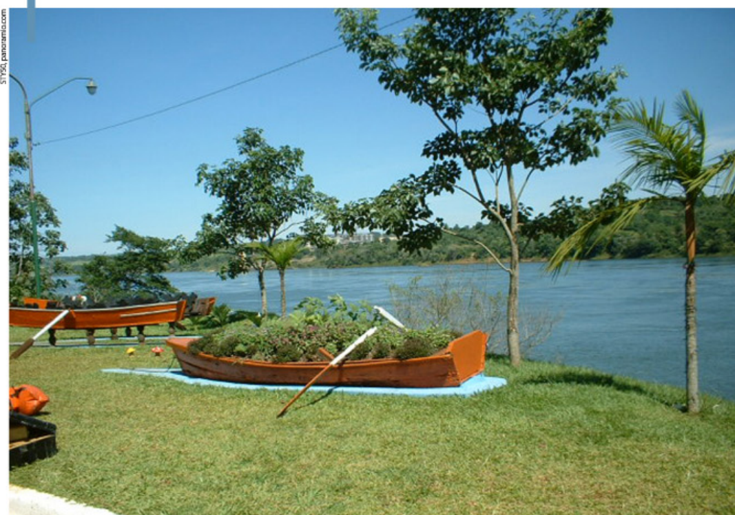
Un espacio de contemplación y solaz frente al imponente río Paraná.