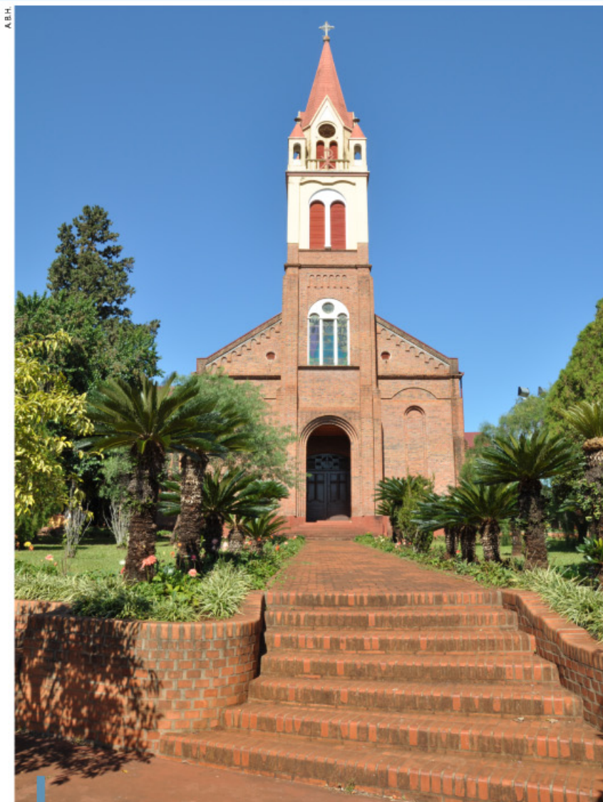
La parroquia San Luis Gonzaga es un ícono de Capioví y referente para los viajeros que transitan por la Ruta Nacional 12.