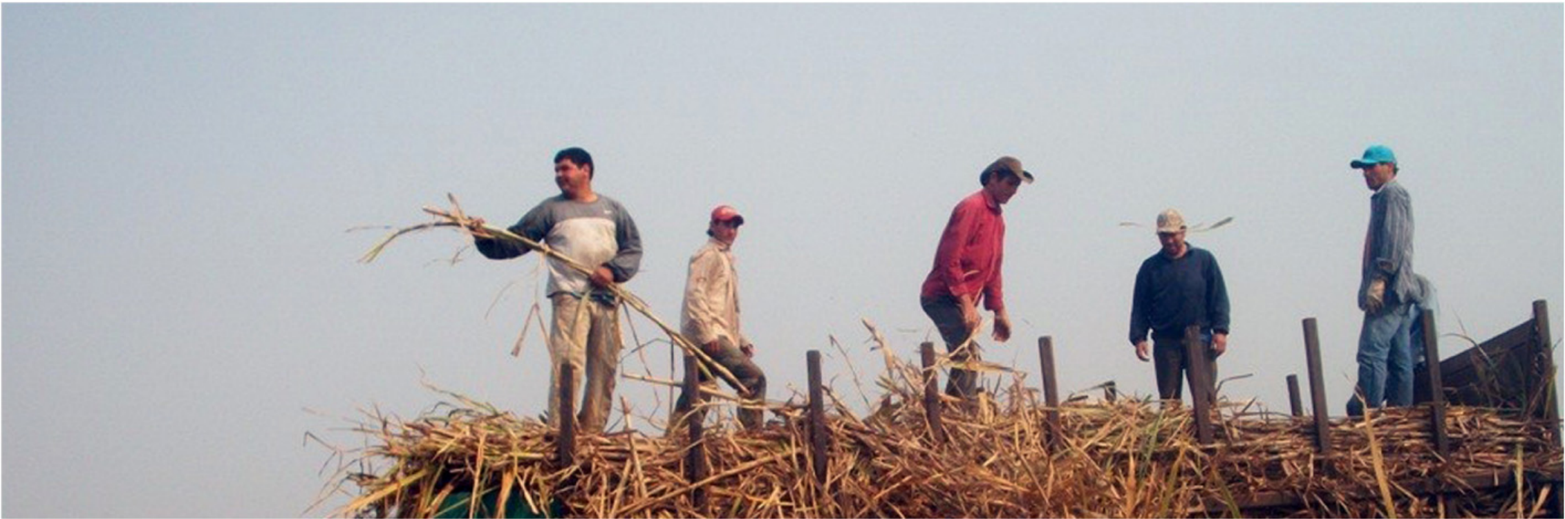
Productores rurales en plena zafra, apuntalando la economía de Mojon Grande.

Fuentes: Stefañuk, Miguel Ángel. "Diccionario Geográfico Toponímico de Misiones". Contratiempo Ediciones, 2009 / Municipalidad de Mojon Grande / Instituto Nacional de Estadística y Censos / Wikipedia / Google Maps