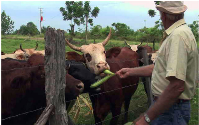
La ganadería se ha consolidado como actividad rentable en el sector rural de la zona.