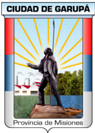
Escudo Municipal de Garupá