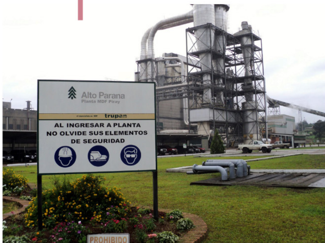
Instalaciones de la planta de producción de MDF Alto Paraná.